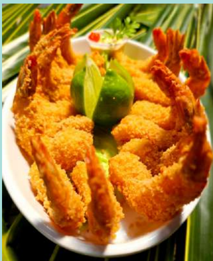
*Camarão à Milanesa